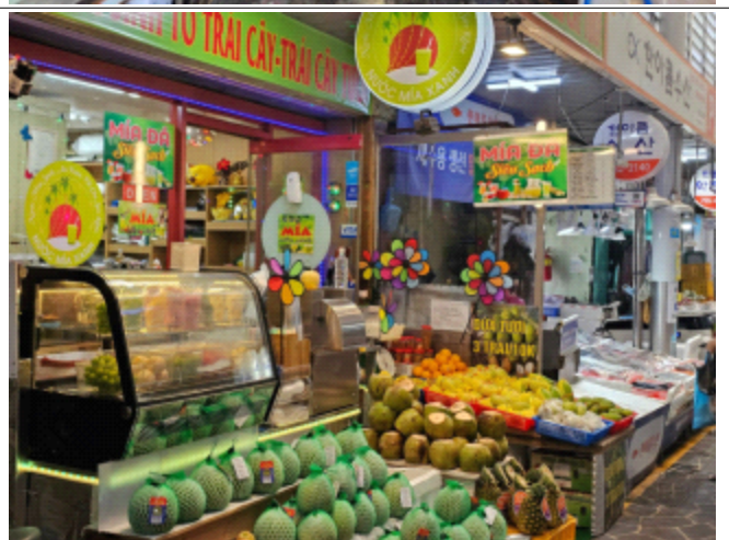
< 자유시장 현장사진 >