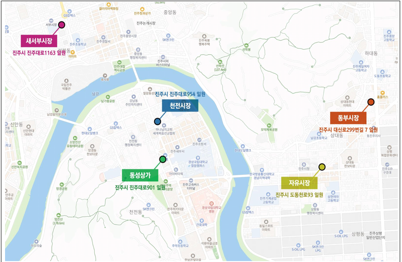
< 대상지 위치도 >